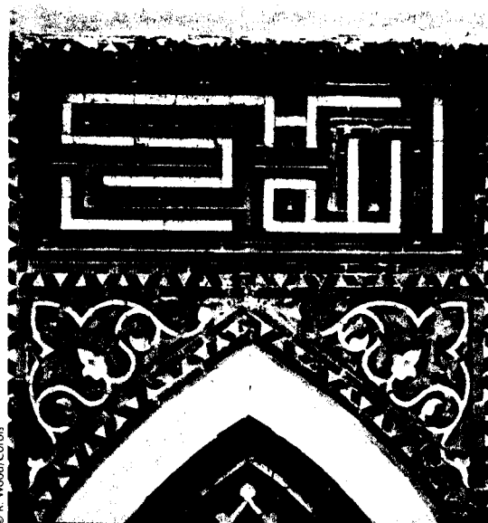
La traduction du nom d'Allah est source d'incessants débats... (ici, un palindrome d'Allah Akbar figurant sur un tombeau d'Ispahan en Iran).

être très différents. Alors que pour les traducteurs des textes sacrés, il s'agit de respecter la parole divine quitte à ce que ce respect – notamment du fait de la non-intégration des éléments culturels – devienne une entrave à la communication – du Bellay, quant à lui, a plaidé pour l'imitation du style et de la syntaxe des