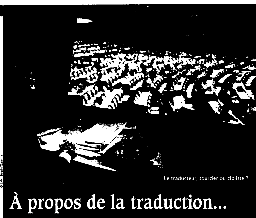
Le traducteur, sourcier ou cibliste ?